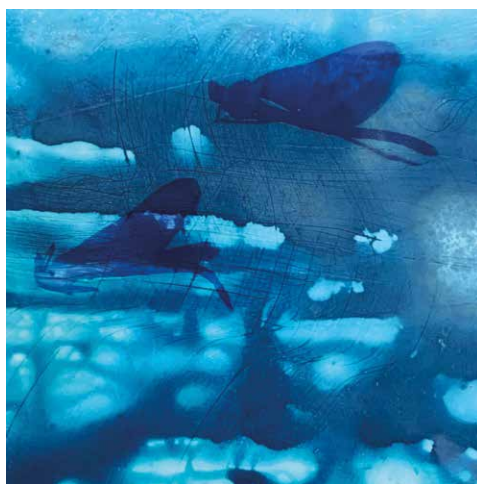
Emmanuel Wütrich - «Trace d'insecte», monotype sur plâtre