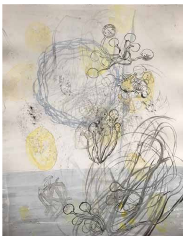
Luc Marelli - «Micro-macro», Impression monotype à l'aquarelle

Unter dem Titel „multiple animal“ und mit Bezug zu den bedruckten Tapeten des Schlosses, sei es in Einklang oder Dissonanz, gestalten vierzehn Künstler aus verschiedenen Regionen der Schweiz Räume der Kontemplation und Reflexion und hinterfragen unsere Beziehung zur Welt, zur Natur und zu anderen Lebewesen.